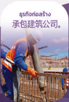
ธุรกิจก่อสร้าง 承包建筑公司。