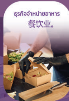
ธุรกิจจำหน่ายอาหาร 餐饮业。