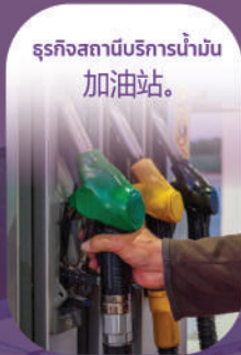
ธุรกิจสถานีบริการน้ำมัน 加油站。