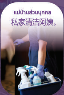
แม่บ้านส่วนบุคคล 私家清洁阿姨。