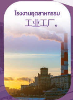
โรงงานอุตสาหกรรม 工业工厂。