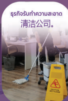
ธุรกิจรับทำความสะอาด 清洁公司。