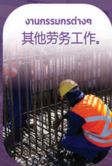
งานกรรมกรต่างๆ 其他劳务工作。

“我们对于不同类型公司的劳工能力需求的差异有一定的了解，并且对于几乎每个类型有需要外籍劳工的公司，小至劳工人数不多的小型公司，大至需要大量劳工的的大型企业的劳工之照顾与服务有丰富的经验。我们有能力针对不同类型公司的顾客招聘筛选出符合需求的劳工”